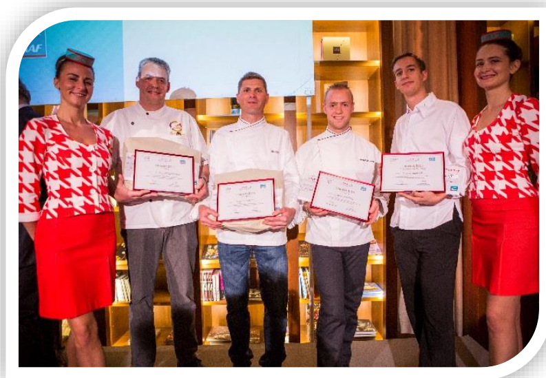
Les 3 lauréats du Prix Goût et Santé des Artisans 2015, ainsi que le Prix Spécial du Jury