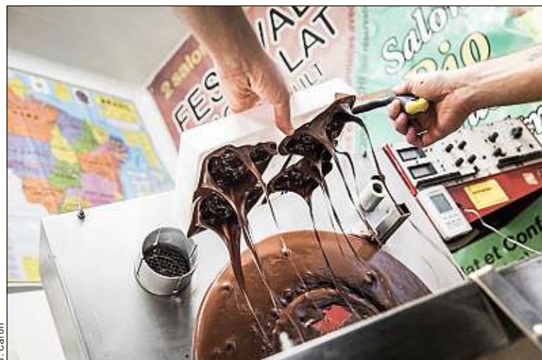
L'artisanat englobe 250 métiers et concerne 3,1 millions de travailleurs.

Grâce à une technique d'impulsion d'air, Arca rend le bois aussi malléable que du textile. Résultat : d'impressionnants systèmes de rangement et des meubles design aux formes aériennes.