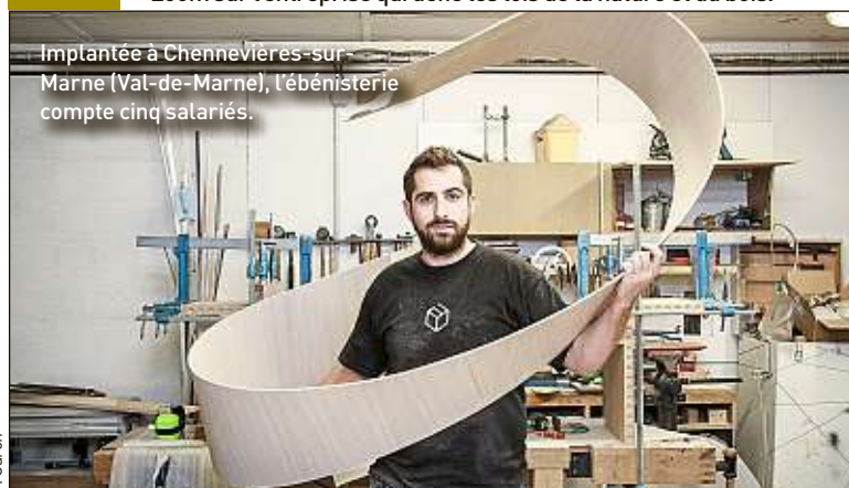
Implantée à Chennevières-sur-Marne (Val-de-Marne), l'ébénisterie compte cinq salariés.

Zoom sur l'entreprise qui défie les lois de la nature et du bois.